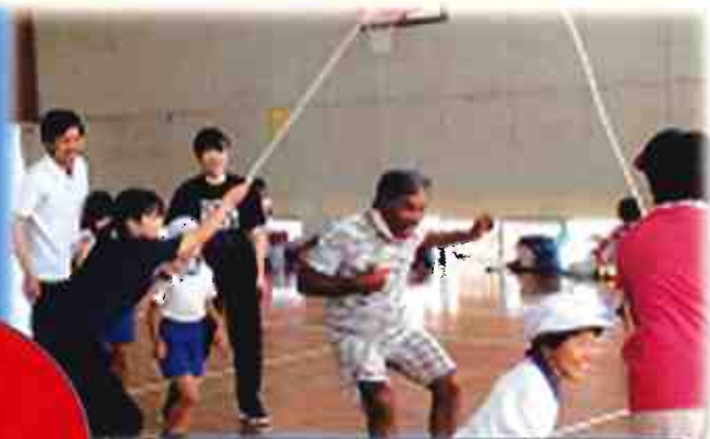
親子で長縄エイトマンに挑戦！