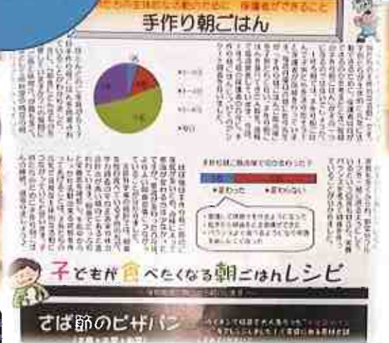
主体的な取組を紹介する魅力的な記事