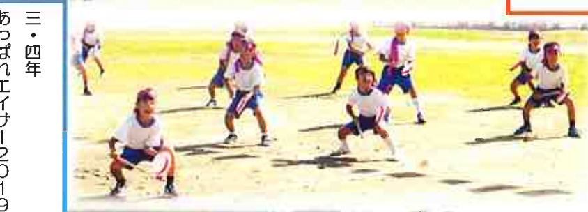
三・四年 あっぱれエイサー2019