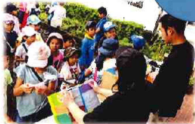
愛校作業で子供たちの参加を増やす工夫