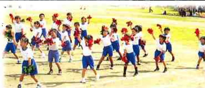
一・二年 勇気・元気☆笑顔いっぱい

この運動会を通して、友達との絆を深めたり、体と心をたくましく鍛えたりすることができました。身に付けた力を、今後の生活においても生かしていってくださることを願います。