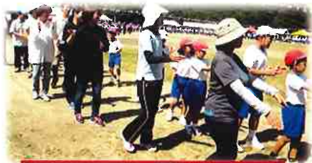
家族みんなで踊った屋久島音頭♪