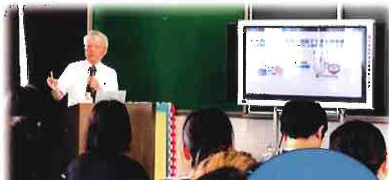
魅力的な講師招聘 子供たちの生活に繋がる講話「眠育」

今年度、安房小PTAは、「子供たちのための主体的で魅力的なPTA活動～学校・家庭・地域の連携を通して～」をテーマに様々な活動に取り組んでいます。学校・家庭・地域が繋がって、ちょっとした工夫やアイデアで、子供たちのために魅力的な活動にしていきたいと思います。これまでの取組を一部紹介します。