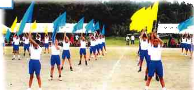
五・六年 Raise your Flag!