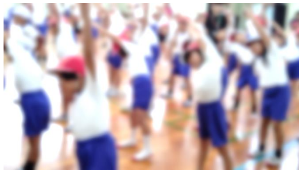
【運動会の練習の様子】

実を結び、どんな輝きを見せてくれるのでしょうか。キラキラと輝く充実した2学期になることを期待しています。